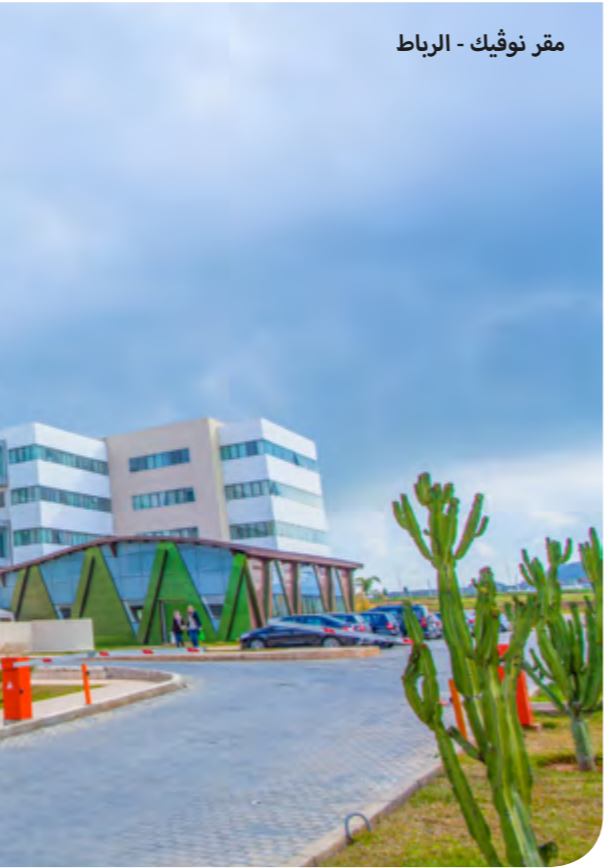
مقر نوثيك - الرباط