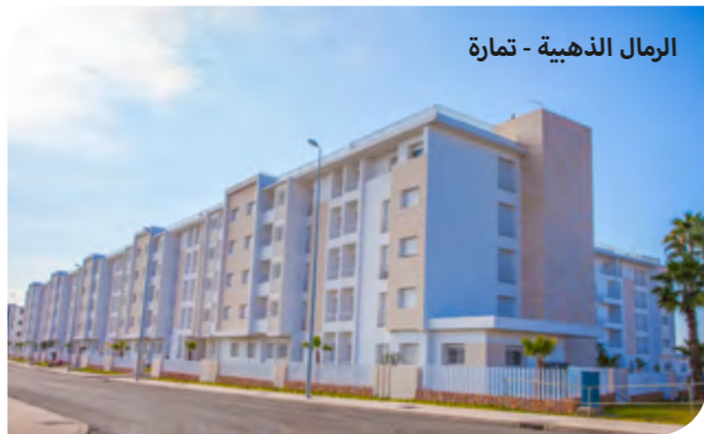
الرمال الذهبية - تمارة